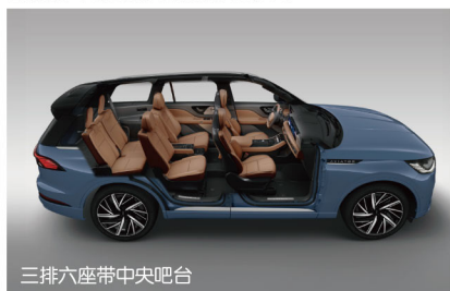
三排六座带中央吧台