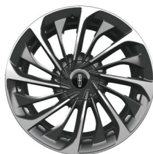
22"16辐高级双色铝合金轮毂 奢雅版