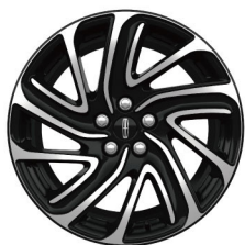
19"高级亮面铝合金轮毂 典雅版