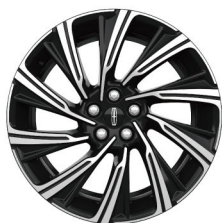
20"高级亮面铝合金轮毂 高雅版 (典雅版六座+¥6,000)