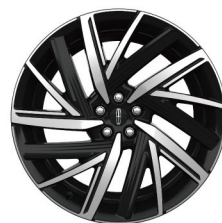
22"15辐高级双色铝合金轮毂 总统版